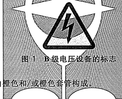
图 1 B 级电压设备的标志

在接近 B 级电压源,如燃料电池电堆、电池、超级电容等的附近应标示图 1 所示的标志。如果移动覆盖物或外壳,使 B 级电路的带电部件和/或基本绝缘暴露时,则在覆盖物或外壳上应有该标志。